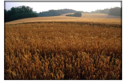
Boschi, prati e campi di grano nel Parco dei Colli Briantei

Pedaleremo insieme alla scoperta delle bellezze naturali del paesaggio del nuovo parco dei colli briantei tra Arcore, Usmate e Camparada. Durante il percorso attraverseremo fitti boschi, campi di grano immersi in un paesaggio collinare che ricorda più la Toscana o l'Umbria che non la laboriosa Brianza. Non mancano nemmeno le testimonianze storiche, quali cascine, cappellette e piccole chiese. Si tratta di un percorso facile, adatto a tutti, con salite di modesta entità. Cinque gruppi di ciclisti partiranno da ritrovi diversi per arrivare alla Villa Scaccabarozzi di Usmate, luogo di partenza della gita. Al ritorno sosta sui prati della Cassinetta dove è previsto un piccolo rinfresco conclusivo. Si consiglia abbigliamento sportivo, berretto, k-way, borraccia e kit per la riparazione di forature. Scarponcini in caso di pioggia nei giorni precedenti.