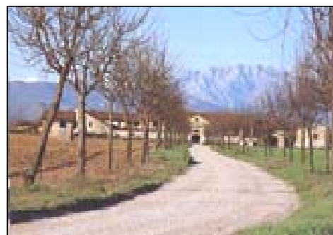
La Cascina Cavallera di Oreno

Si tratta di un percorso interamente pianeggiante di circa 8 km sviluppato principalmente su strade di campagna non asfaltate. Quattro gruppi di ciclisti partiranno da ritrovi diversi per arrivare alla Cascina Cavallera proseguendo insieme sino ai prati della Cascina Lodovica dove è previsto un piccolo rinfresco conclusivo. Si consiglia abbigliamento sportivo, berretto, crema solare, k-way, borraccia e kit per la riparazione di forature.